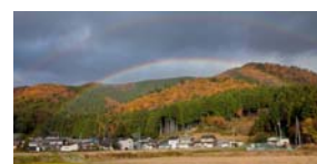
滋賀県高島市の様子 （公式 HP より）