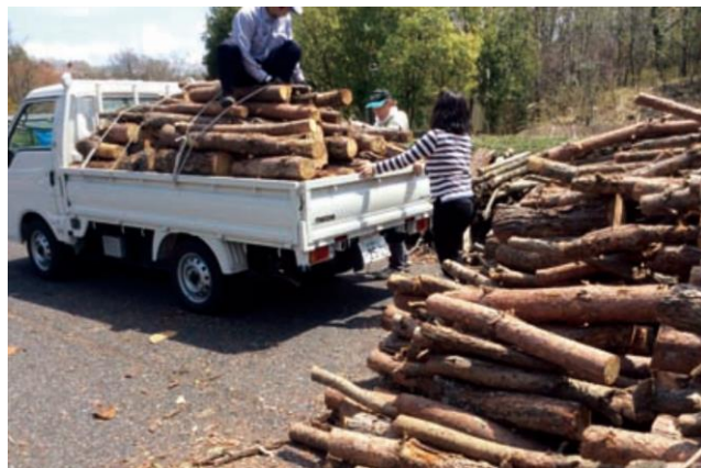
間伐材を運び込む様子